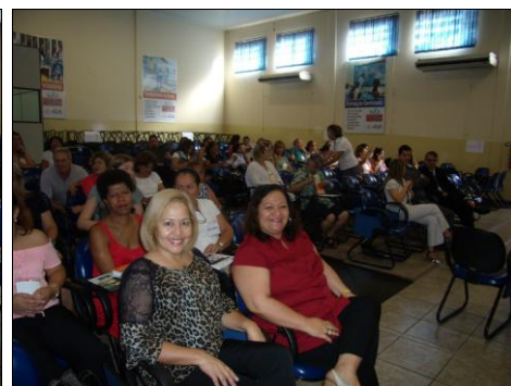
Foto: Oficinas realizadas com os futuros participantes do Concurso.